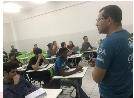
sensibilização de discentes