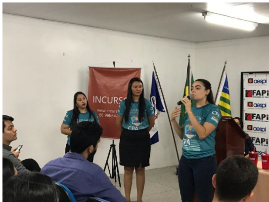
Sensibilização do corpo docente