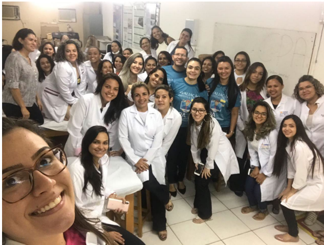
visita da CPA a sala de aula